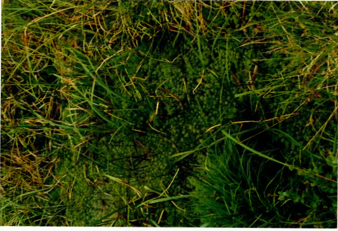
Lähdeneva, pohjoisosa, rimpiäntaa lähteikön, Tuntomassa.