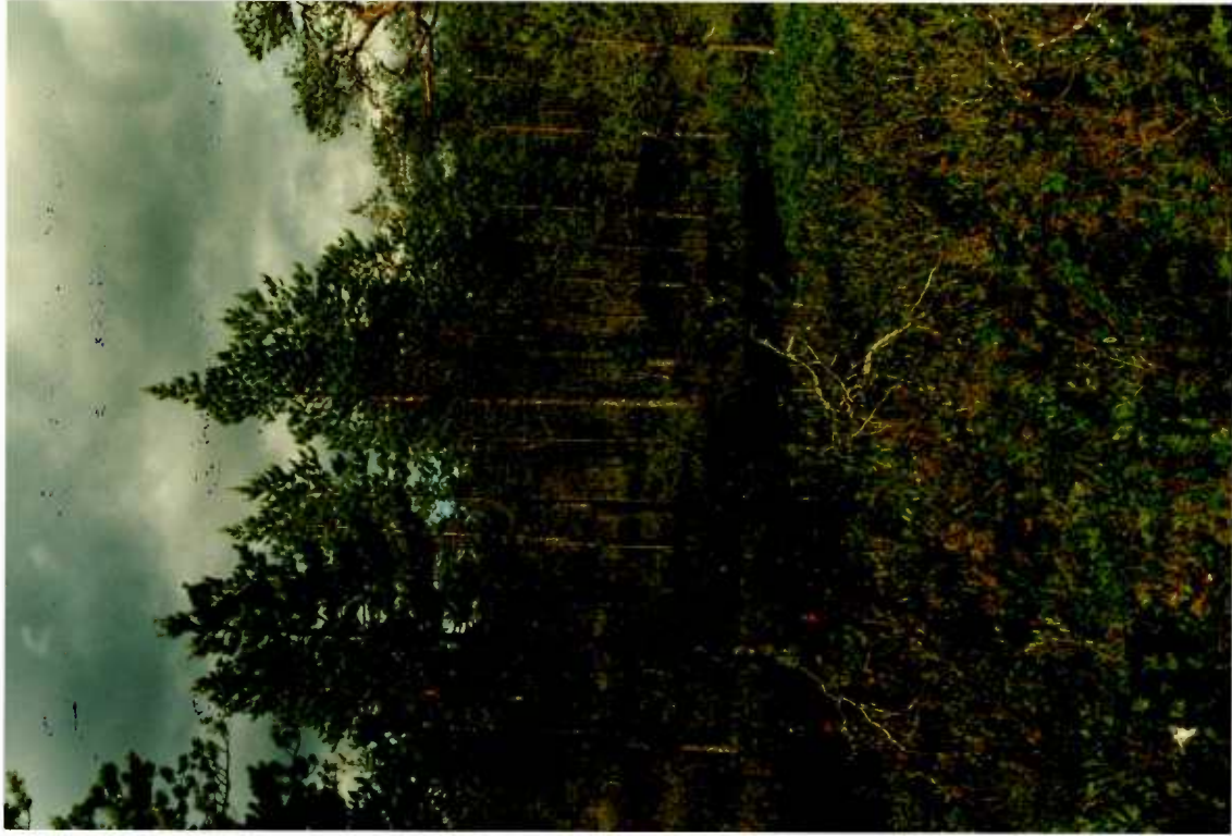
Lähdeneva, pohjoisosa, isovarpurämettä