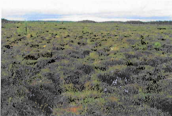
Kuva 1. Nevamuuttuma suon pohjoispuolella

Suon eteläpuolella on pienehkö, lähes luonnontilainen avosuo-alue, joka on luontotyypiltään yhdistelmä oligotrofisesta lyhytkorsinevasta (OILkN) ja rahkarämeestä (RaR) . Lyhytkorsinevan kenttäkerroksen valtalaji on tupasvilla ( Eriophorum vaginatum ). Pohjakerrosta hallitsee jokasuonrahkasammal ( Sphagnum angustifolium ).