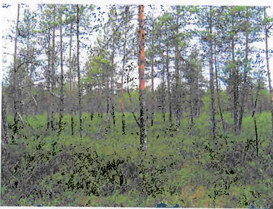
Kuva 3. Rämemuuttuma suon keskiosassa

Inventointialueen keskiosassa on metsäsaareke, joka on luontotyypiltään tuoretta kangasta (puolukka-mustikka tyyppi, VTM). Puustossa esiintyvät mänty ( Pinus sylvestris ), hieskoivu ( Betula pubescens ) ja kuusi ( Picea abies ). Puusto on vielä suhteellisen nuorta, eikä seisovaa kelo puuta ole. Kenttäkerrosta hallitsevat mustikka ja puolukka ( Vaccinium myrtillus , V. vitis-idaea ). Pohjakerroksen yleisimmät sammaleet ovat kerrossammal ( Hylocomnium splendens ) ja seinäsammal ( Pleurozium schreberi ).