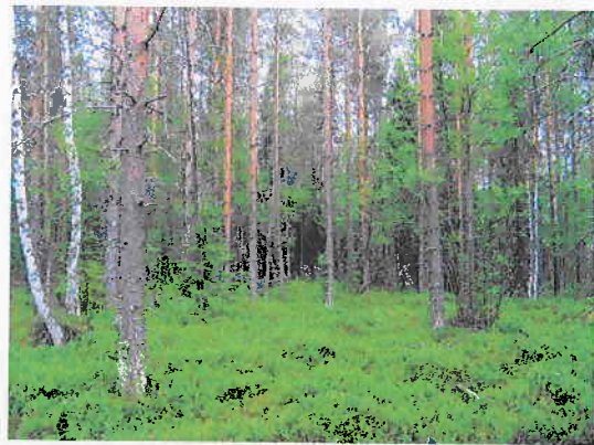
Kuva 4. Tuoretta kangasta metsäsaarekkeessa