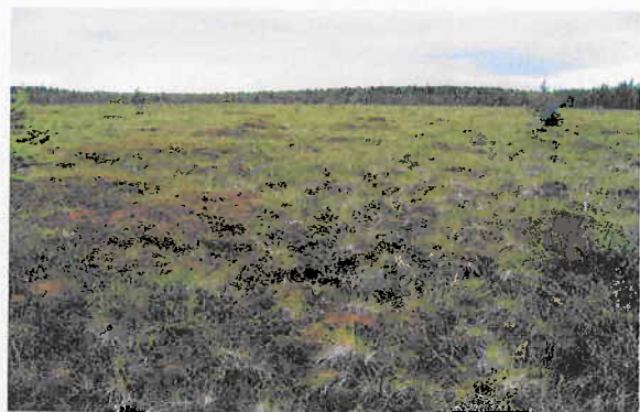
Kuva 2. Melko luonnontilaista oligotrofisen lyhytkorsinevan ja rahkarämeen yhdistelmää