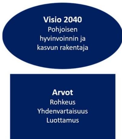
Kuva 1. Pohjois-Pohjanmaan maakunta-ohjelman 2022–2025 visio ja arvot.

Maakuntaohjelmaa 2022–2025 on valmisteltu vuoden 2020 lopun ja vuoden 2021 aikana laajassa sidosryhmäyhteistyössä. Näkemyksiä ohjelman valmistelun tueksi on kerätty muun muassa maakuntaliiton taustatyön ja toimintaympäristön muutostarkastelun avulla, taustakeskustelujen kautta eri sidosryhmien kanssa sekä yhteisesti strategiatyöpajasarjan aikana helmi-maaliskuussa 2021. Työskentelyn perusteella on muodostettu visio, kehittämisen arvot ja päätavoitteiden viitekehys (kuva 1).