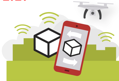
Digitaaliset palvelut ja tuotteet