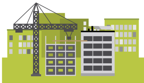
Kestävä rakentaminen ja liikkuminen