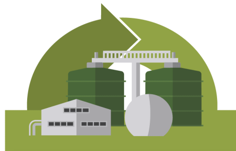
Innovatiivinen bio- ja kiertotalous