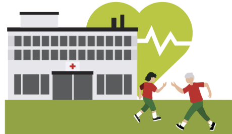
Terveyden ja hyvinvoinnin ala