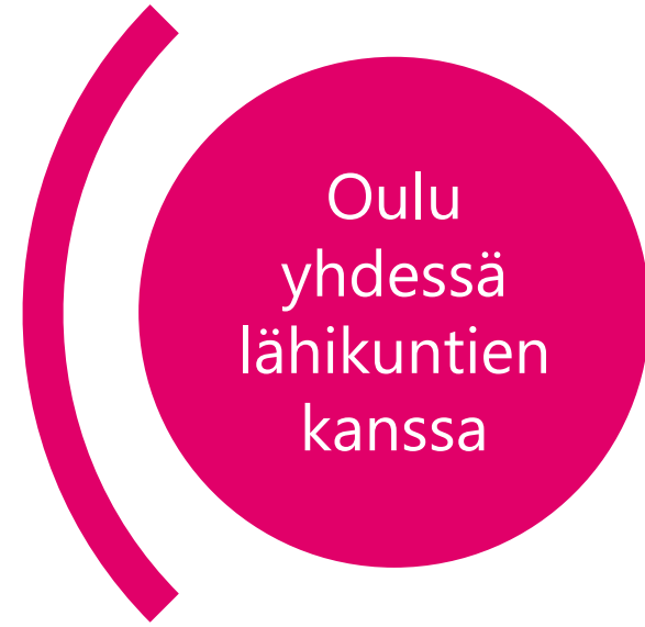
Valmistelulinjaus KH 5.6.23, Päätös työllisyysalueesta KH 16.10.23