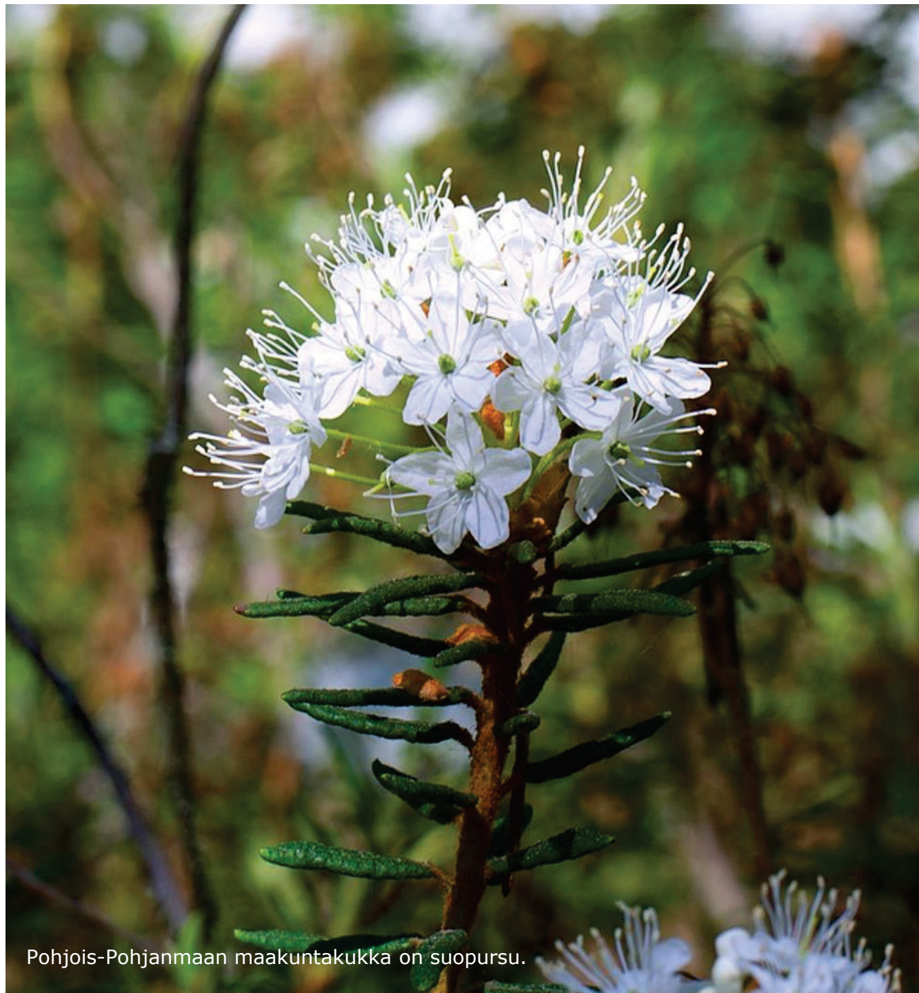
Pohjois-Pohjanmaan maakuntakukka on suopursu.

Emme omista maata – lainaamme sitä tulevilta sukupolvilta