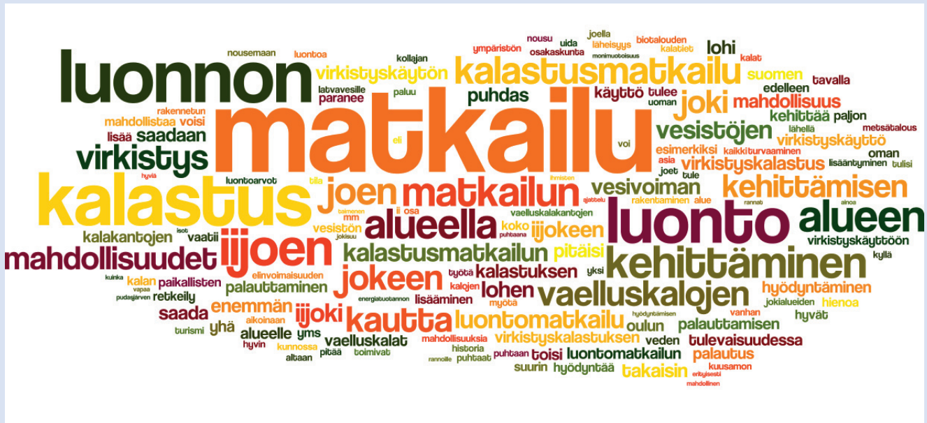
Kuvio 1. Iijoen arvot -kyselyn mukaan matkailussa, kalastuksessa ja luontoarvoissa nähtiin alueen suurimmat tulevaisuuden mahdollisuudet.

Visiotyön aikana koottiin laaja ideapankki vision tavoitteita tukevista kehittämishankkeista Iijoen alueella. Visio konkretisoituu erillisen toimenpideohjelman kautta, jossa kuvataan keinot päästä tavoitteisiin. Kuviossa 2 on esitetty myös vision jatkotyön prosessi sekä vision toteutumisen mahdollistavat tekijät.