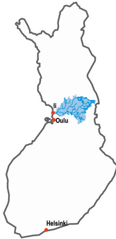
Kuvio 3. Iijoen vesistöalue.