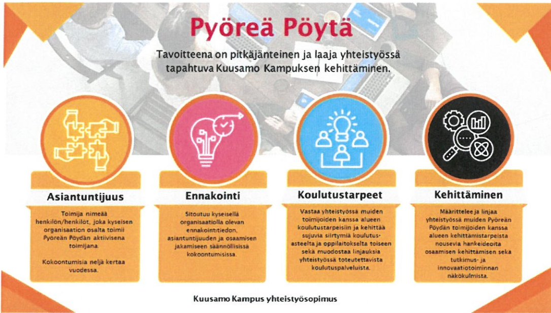
Kuva 7 Pyöreän Pöydän toiminta

Kuusamo Kampus toimintamallissa kampuskoordinaattori toimii toiminnan koordinoijana, kehittäjänä ja yhdyshenkilönä eri toimijoihin. Pyöreän Pöydän kautta saadaan painopisteet ja linjaukset toiminnalle. Se toimii yhteistoiminnan ohjaajana ja vastaa seurannasta. Ennakointitiedolla on keskeinen merkitys toiminnan suunnittelun pohjana. Yhteistyössä muotoillaan kuvaa tulevaisuuden osaamis- ja koulutustarpeista. Käytännön toimijat kokoontuvat säännöllisesti edistämään sovittuja asioita ja nostamaan Pyöreän Pöydän keskusteluun uusia yhteistyöideoita.