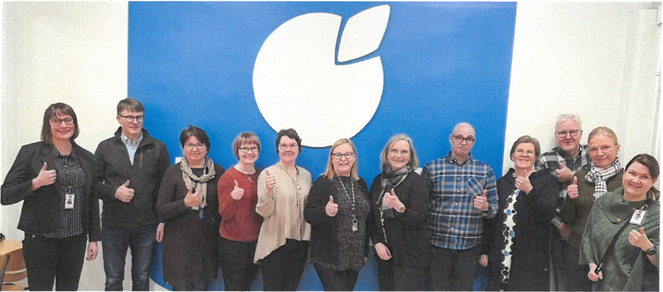
Kuva 5, 17.11.2023 järjestetyn Pyöreän Pöydän osallistujia

Kuusamo Kampus Pyöreän Pöydän toiminta jatkuu hankkeen päättymisen jälkeen sopimuskumppaneiden nimettyjen toimijoiden kokoontuessa säännöllisesti vähintään neljä kertaa vuodessa. Kuusamo Kampus yhteistyösopimuksen keskeisenä yhteistyömuotona jatkossa toimii nimenomaan Pyöreä Pöytä. Toimintamalli vakiintuu toimintatavaksi toistaiseksi voimassa olevan sopimuksen myötä.