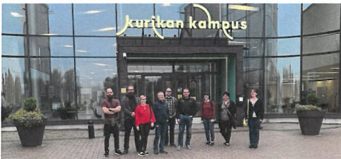
Kuva 1 Tutustumassa Kurin Kampukselle

Osana tilasuunnittelua ja kampusmalleihin perehtymistä hankkeessa toteutettiin kampusvierailut Savon koulutuskuntayhtymän Savilahden kampukselle Kuopioon ja Sedun Kurin kampukselle. Kampusvierailuihin osallistui yhdeksän henkilöä. Mukana oli henkilöstöä kasvatus- ja sivistystoimialalta, (sis. lukio), yhdyskuntatekniikan toimialalta ja Kainuun ammattiopiston Kuusamon toimipaikasta. Vierailun jälkeen toteutettiin yhteinen koontitilaisuus.