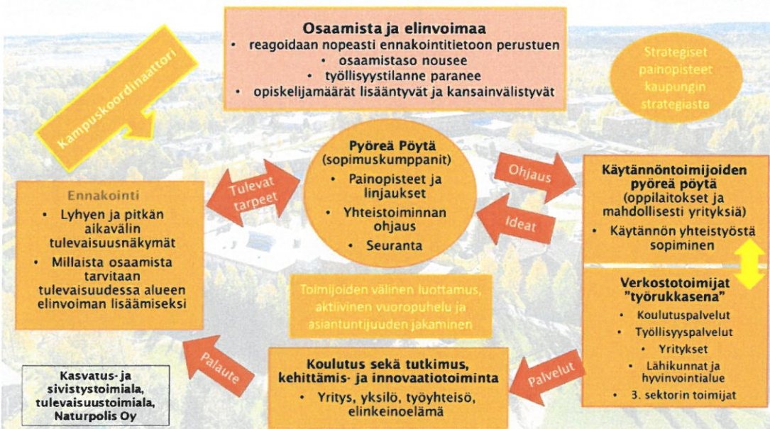
Kuva 8 Kuvaus Kuusamo Kampuksen toimintaprosessista

Kuusamo Kampus toimintamallissa kampuskoordinaattori toimii toiminnan koordinoijana, kehittäjänä ja yhdyshenkilönä eri toimijoihin. Pyöreän Pöydän kautta saadaan painopisteet ja linjaukset toiminnalle. Se toimii yhteistoiminnan ohjaajana ja vastaa seurannasta. Ennakointitiedolla on keskeinen merkitys toiminnan suunnittelun pohjana. Yhteistyössä muotoillaan kuvaa tulevaisuuden osaamis- ja koulutustarpeista. Käytännön toimijat kokoontuvat säännöllisesti edistämään sovittuja asioita ja nostamaan Pyöreän Pöydän keskusteluun uusia yhteistyöideoita.