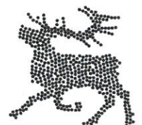
Kuva 3 Poimintoja Monikampus Finland sivustolta

Kuusamon kaupunki toimi verkostotoiminnan koordinoijana ja alustana, joka mahdollistaa kumppaneiden kanssa työlläminä tarpeisiin vastaavien koulutusten saatavuuden alueella. Kuusamo Kampus yhteistyösopimuksen on ensimmäisessä vaiheessa allekirjoittanut 14 toimijaa niin toisen kuin korkeasteen oppilaitoksia, vapaansivistystyön toimijoita lähikuntia, yrittäjäjärjestöjä ja kehittämissyhtiö.